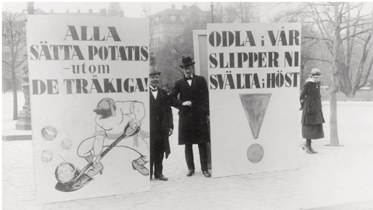
Bild från 1917.

Tidningar som Borås tidning, Jordbruksaktuellt och Landets fria tidning har skrivit om Potatisuppropet och initiativet har även tagits upp i Sveriges radios program Odlar i P1.