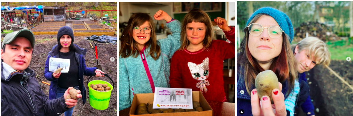
Bilder från 2020.